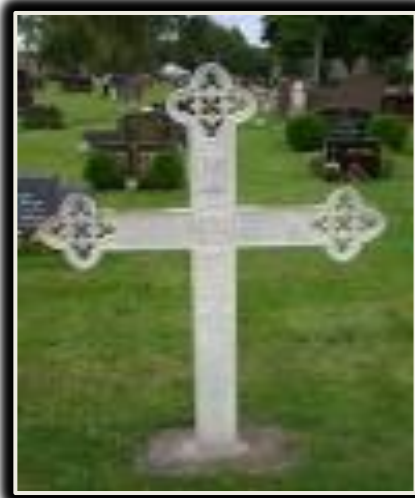
Bilde fra DIS gravminner