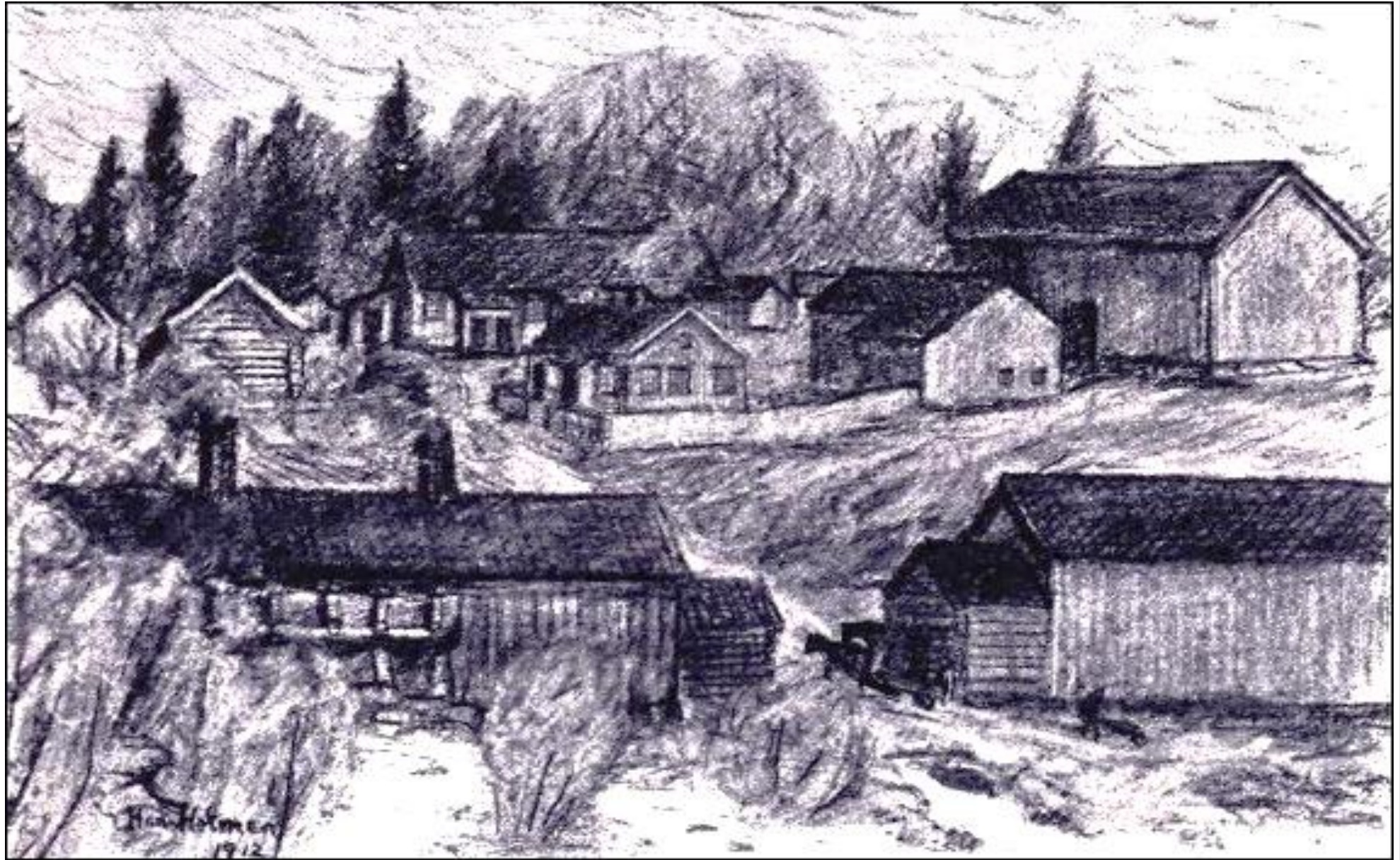
Hans Holmens kulltegning av nedre Verk på Hagnes